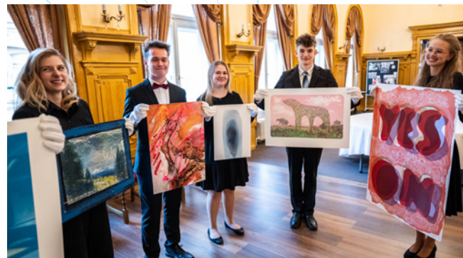
Studentní SŠ J. Blahoslava z Hejnic se opět ujali důstojné prezentace děl při aukci.

Děkujeme všem, kteří svou nezištnou pomocí, časem a osobním nasazením umožnili, aby nadace mohla fungovat a plnit své poslání.